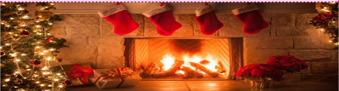
Programmation Hiver 2025-2026

VACANCES DES FÊTES DU 24 DÉCEMBRE 2025 AU 4 JANVIER 2026